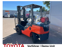
TOYOTA Vorführer / Demo Unit