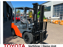
TOYOTA Vorführer / Demo Unit