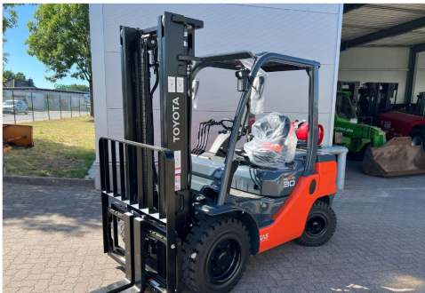
TOYOTA Vorführer / Demo Unit

Es gelten unsere Verkaufs- und Lieferungsbedingungen.