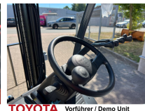
TOYOTA Vorführer / Demo Unit

Preis: 23.900,00 € (zzgl. MwSt.) (Zwischenverkauf vorbehalten)