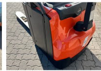
TOYOTA Werksüberholt / Factory refurbished

Price: 7.950,00 € (excl. VAT.) (Subject to prior sale)