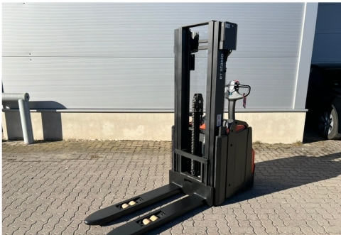
TOYOTA Werksüberholt / Factory refurbished

We expressly point out that the above statements on the device do not represent any represent warranted characteristics. These are to be inquired directly with the responsible salesman in our house However, only the information/properties according to the content of the purchase contract are ultimately relevant.