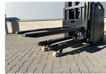
TOYOTA Werksüberholt / Factory refurbished