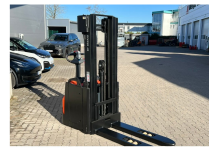
TOYOTA Werksüberholt / Factory refurbished