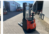
TOYOTA Werksüberholt / Factory refurbished