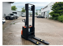
TOYOTA Werksüberholt / Factory refurbished