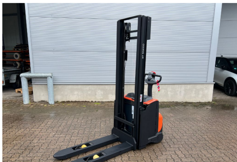
TOYOTA Werksüberholt / Factory refurbished

Es gelten unsere Verkaufs- und Lieferungsbedingungen.