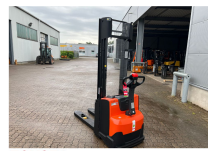
TOYOTA Werksüberholt / Factory refurbished