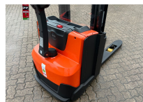
TOYOTA Werksüberholt / Factory refurbished

Preis: 5.650,00 € (zzgl. MwSt.) (Zwischenverkauf vorbehalten)