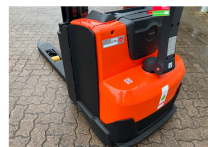
TOYOTA Werksüberholt / Factory refurbished